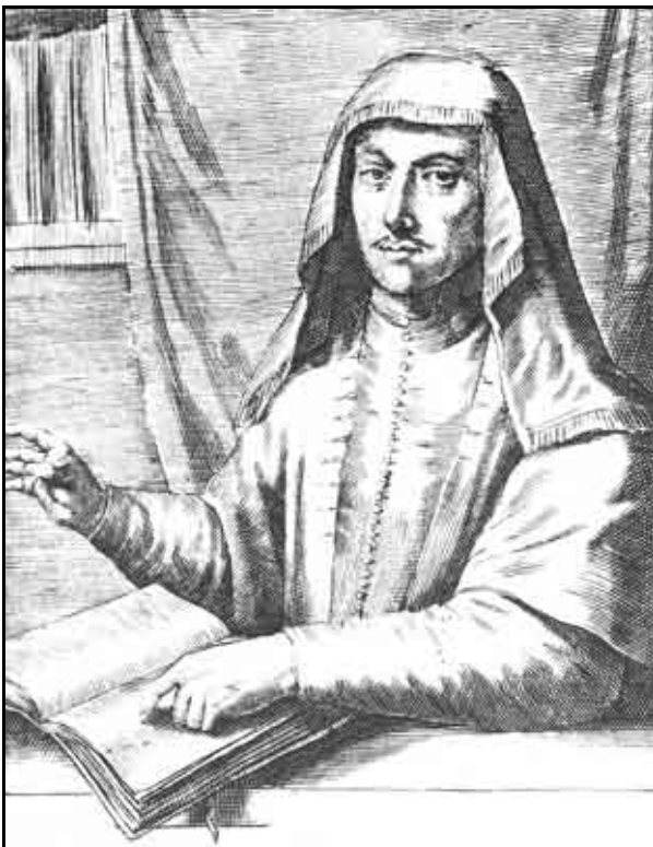
Verklighetstroget porträtt av Nathan i Gaza, tecknat av ett ögonvittne i Smyrna, 1667. Från Thomas Coenen, Ydele Verwachtinge der Joden... (Amsterdam, 1669)