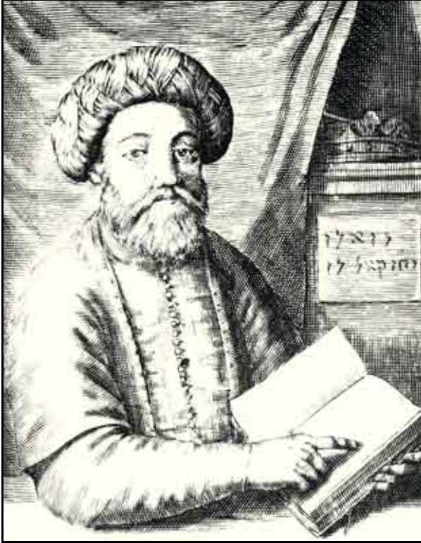
Ett verklighetstroget porträtt av Sabbatai Sevi, tecknat av ett ögonvittne i Smyrna, 1666. Från Thomas Coenen, Ydele Verwachtinge der Joden... (Amsterdam, 1669)