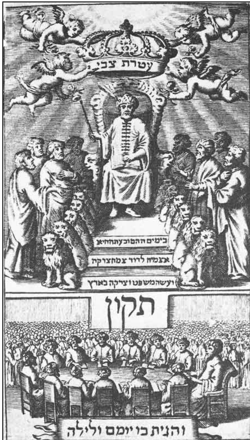
Sabbatai Sevi sitter som messias på kungatronen under en evig krona som hålls uppe av änglar vilka bär inskriptionen "Sevi's Krona." Bilden under: de 10 stammarna studerar Toran med messias. Från en etsning efter titelsidan av Nathans Tiqqun Qeri'ah (Amsterdam 1669)